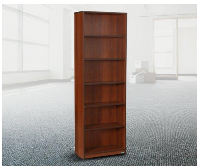
02. Filling Rack –I