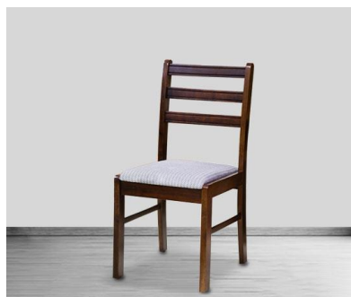
05. Chair –I